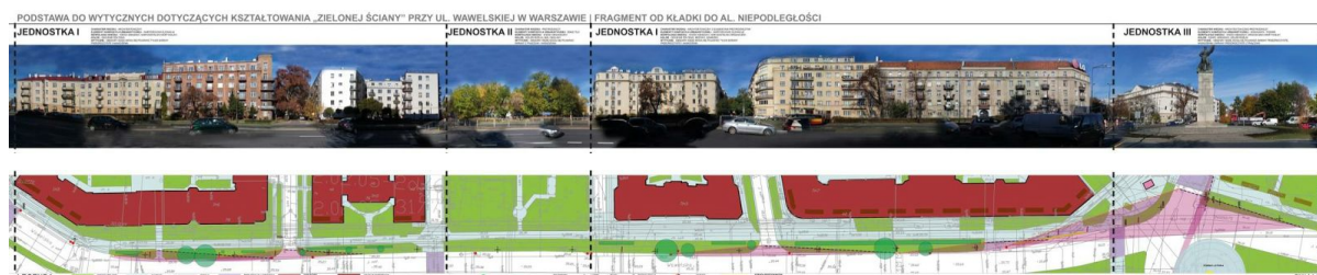
Widok na północną stronę ul. Wawelskiej wraz z rzutem (opracowanie KSK SGGW)

Na podstawie opinii mieszkańców oraz ekspertów poszczególnych jednostek m.st. Warszawy powstał projekt koncepcyjny „Zielonej Ściany” autorstwa architektów krajobrazu z Katedry Sztuki Krajobrazu Szkoły Głównej Gospodarstwa Wiejskiego. Koncepcja ta będzie podstawą do projektów wykonawczych docelowej inwestycji, której prace przygotowawcze rozpoczną się w 2016 roku. Inwestycja zostanie zrealizowana najprawdopodobniej na wiosnę 2017 roku. Obecnie zakłada się, że projekt będzie realizowany przez Zarząd Oczyszczania Miasta.